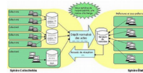
Image 5 Le schéma du contrôle de légalité

Les paragraphes qui suivent concernent les actions tant de sensibilisation que d'élaboration de référentiels dans