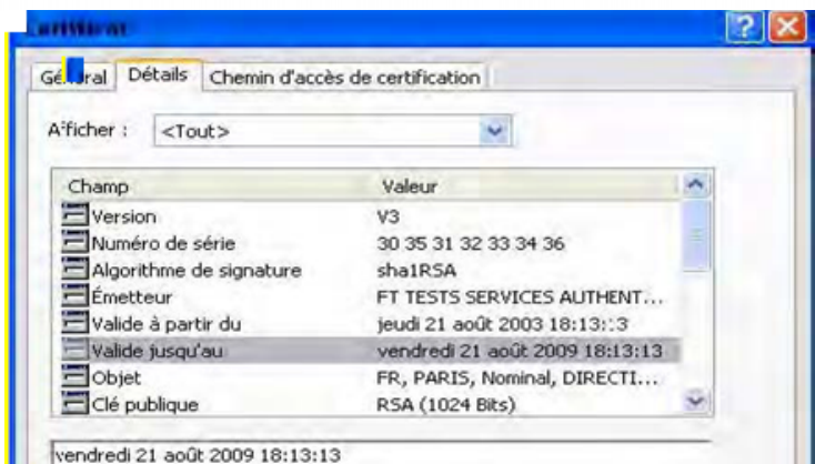
Image 3 Interface de gestion d'un certificat

Prestataires de Service de Certification électroniques conformément aux exigences de l'arrêté du 26/07/2004, qui délivrent des certificats qualifiés (Site du ministère de l'Économie, de l'industrie et de l'emploi) Il n'y a que deux prestataires qualifiés. Chacun de ces prestataires a défini une Politique de Certification : Banque de France : Politique de certification - Autorité de certification - Signature Gamme "signature qualifiée" version 1.1 du 28 décembre 2006 Notaires de France : Politique de Certification Pour les Certificats Qualifiés Support au Service de Signature. Version : 01.02 du 30/05/2007