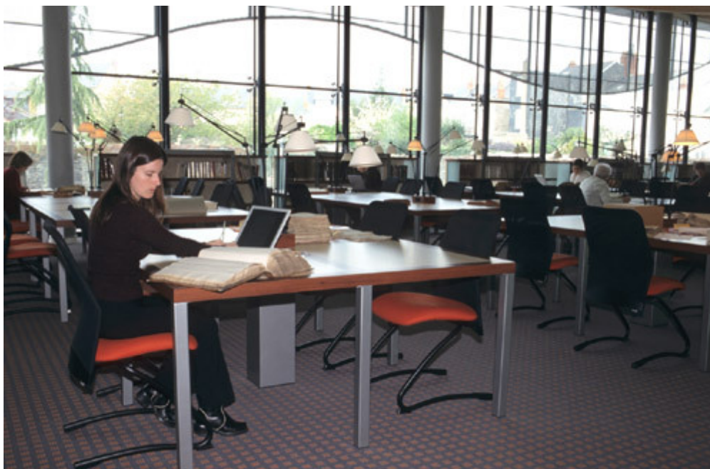
Image 9 Espace de consultation.

Cet espace permet au chercheur de disposer d'une place individuelle où il consultera des documents originaux en forme classique : parchemin, papier.