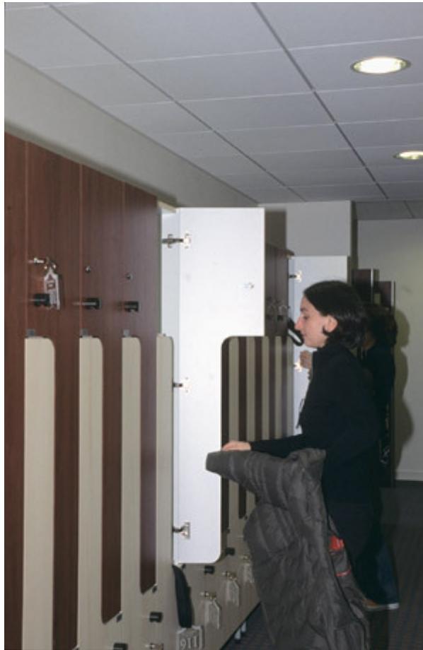
Image 7 Le vestiaire.

Il convient alors de ne pénétrer dans la salle de lecture qu'avec les éléments indispensables au travail à effectuer : papier, crayons, ordinateur portable (hors étui). Les pochettes et sacs à main de petite taille peuvent aussi éventuellement être conservés.