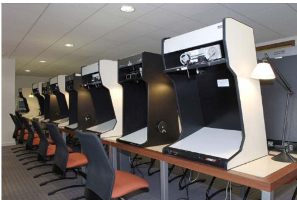
Image 11 Salle des microfilms.

La présence d'un appareil au moins s'avère indispensable pour effectuer les tirages de microfilms, mais il n'est pas utile que le parc en soit très important. On estime à un pour dix lecteurs simples, la proportion d'appareils reproducteurs satisfaisante.