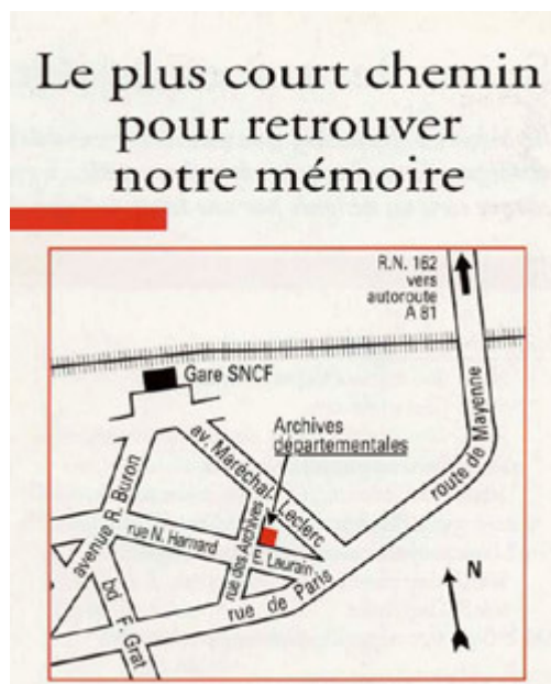
Image 2 Photo "le plus court chemin pour retrouver notre mémoire".