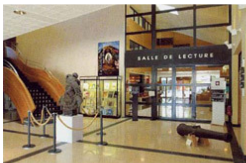
Image 4 Hall d'accueil des Archives départementales de la Manche.

Lorsque ces espaces sont vastes et nombreux, la présence d'un poste d'accueil dans le hall d'entrée , ayant pour vocation l'orientation des visiteurs, est à conseiller.