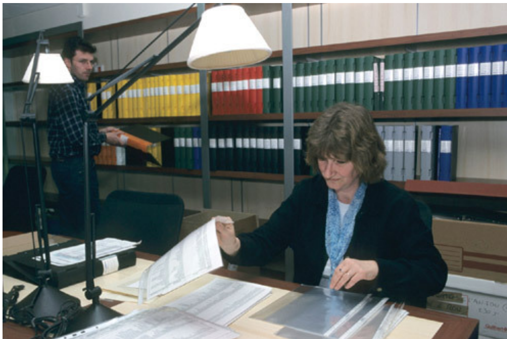
Image 8 Consultation inventaire.

Selon la nature de l'information qu'il recherche, il pourra avoir recours à différents outils qui doivent être proposés de manière simple, pratique et bien signalisée, à l'intérieur des espaces de consultation. Il s'agit des :