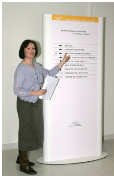
Image 5 Circuit de circulation.

humains du service d'archives ne permettent pas d'y recourir.