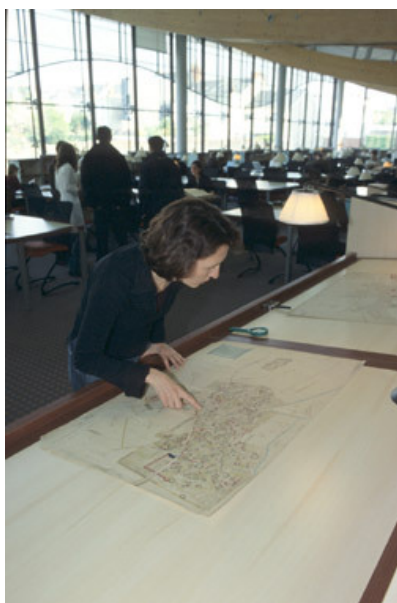
Image 10 Consultation de plans.

La consultation des cartes, plans, affiches et en général des documents de grand format impose des précautions particulières .