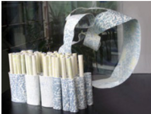
Une création musicale aux Archives nationales (site de Pierrefitte), 2015 : « Silencieusement », Les musiques de la boulangère.

Une création musicale (chœur et orchestre) en 6 mouvements et 6 lieux dans le bâtiment des AN à Pierrefitte, par le compositeur Nicolas FRIZE. Elle est l'aboutissement d'une résidence de deux années aux AN : écoute du quotidien sonore, social et professionnel du lieu, de liens dynamiques avec acteurs et personnes ressources.