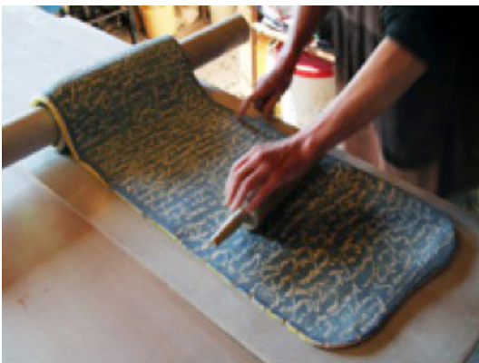
Le temps de l'écriture et celui de la transmission

L'œuvre elle-même, est une triple composition, dans laquelle les différentes pièces entrent en résonance les unes avec les autres mais aussi avec le texte, dans le cadre de la mission des Archives départementales créées en 1796, et l'espace où elles sont exposées.