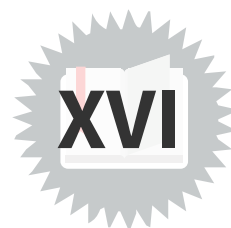
Tableau d'archivage p.44