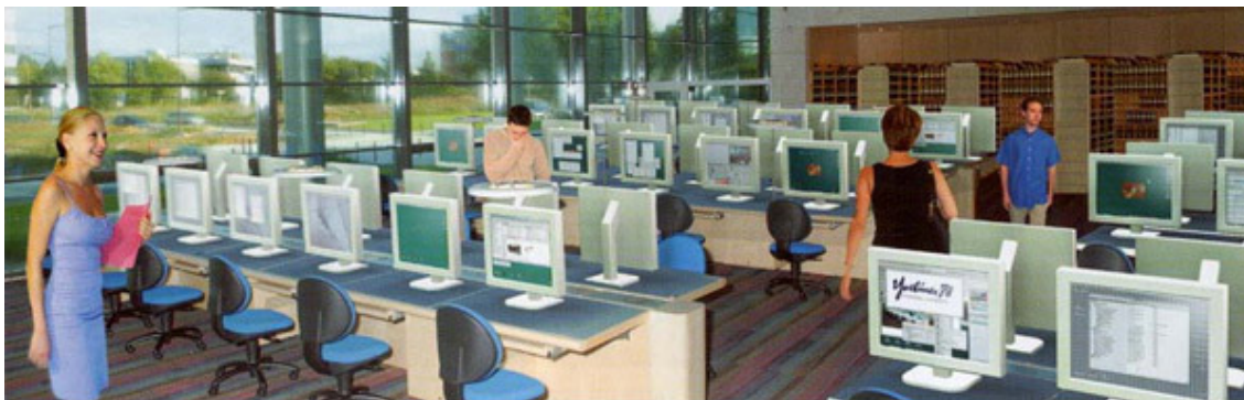
Équipement numérique de la salle de lecture des Archives départementales des Yvelines.

Peu à peu, les stations de lecture numérique ont tendance à se substituer à celles, plus anciennes de microfilms, et les deux supports voisinent généralement dans les mêmes espaces :