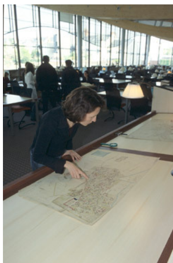
Consultation de plans.

La consultation des cartes, plans, affiches et en général des documents de grand format impose des précautions particulières .