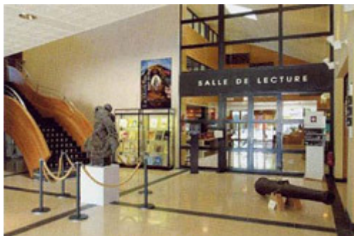
Hall d'accueil des Archives départementales de la Manche.