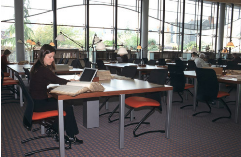
Espace de consultation.

Cet espace permet au chercheur de disposer d'une place individuelle où il consultera des documents originaux sous forme classique : parchemin, papier.