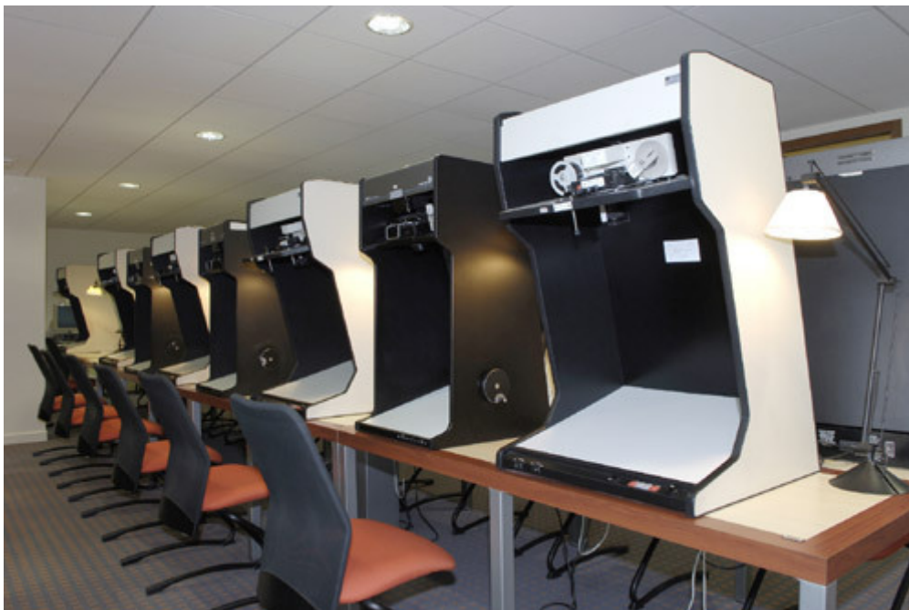
Salle des microfilms.

Les appareils actuels semi-numériques offrent l'avantage de pouvoir numériser le tirage et de le transférer, si besoin, sur ordinateur.