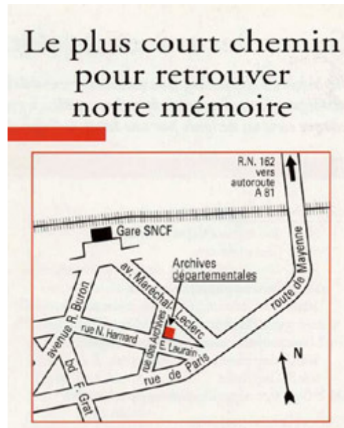
Photo "le plus court chemin pour retrouver notre mémoire".