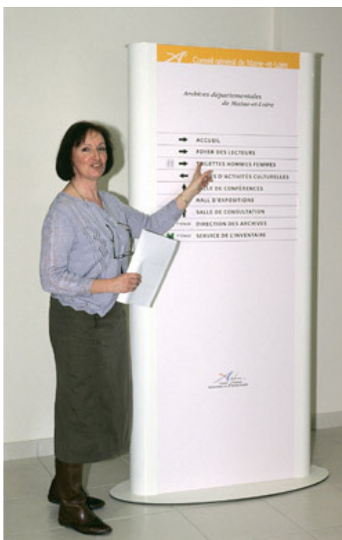
Circuit de circulation.

La signalétique joue également un rôle important dans le confort et l'orientation du public : pictogrammes, fléchages, titrages, doivent conduire le visiteur vers sa destination